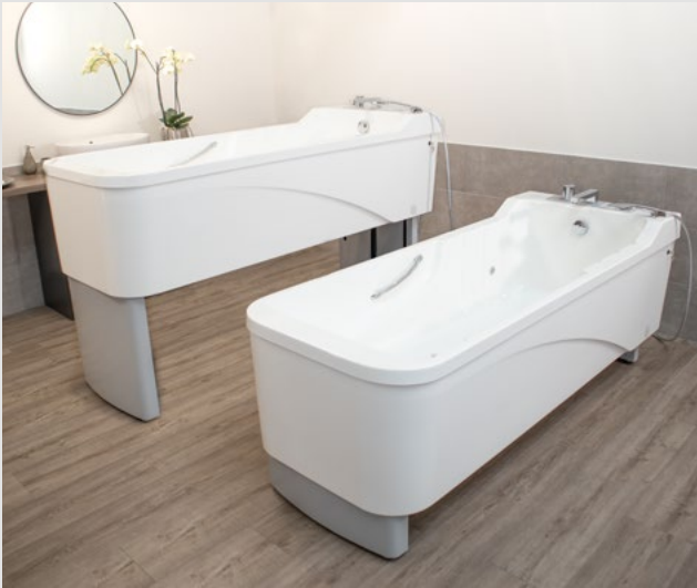
Grande amplitude de levage de 400 mm avec hauteur min. = 683 mm et hauteur max. = 1.083 mm