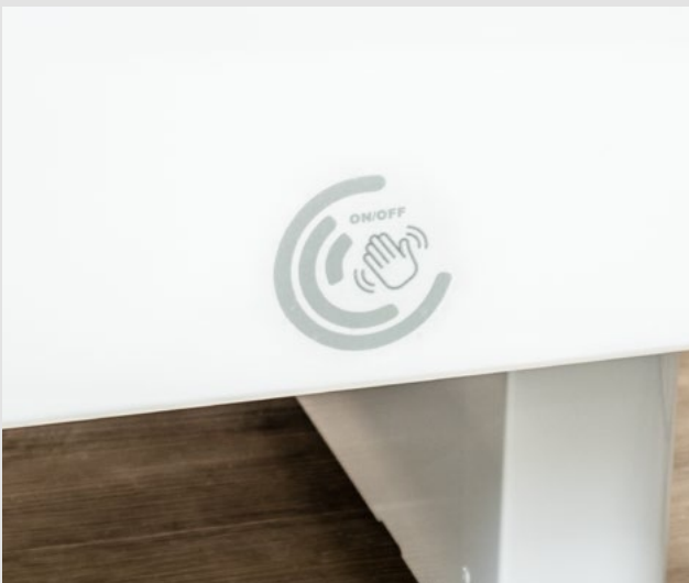
Fonction de verrouillage via un capteur sensible (Autres variantes de verrouillage disponibles en option)