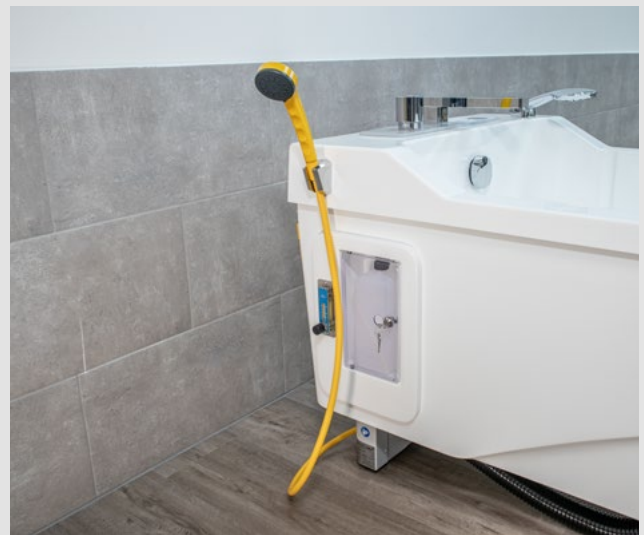
En option: système de désinfection intégré