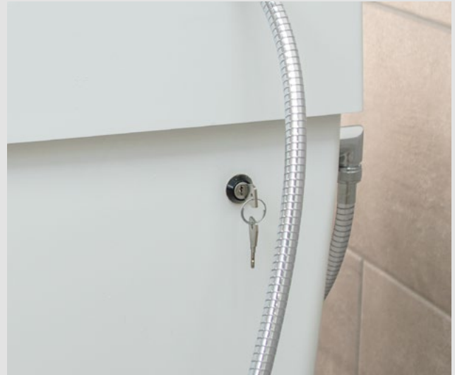
Interrupteur à clef pour le rinçage thermique anti-légionelles * Désactivation de la protection électrique anti-brûlure.

*Dépendant de l'alimentation en eau chaude sur place