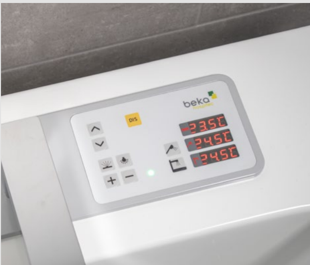
Panneau de commande avec l'affichage de température de l'eau de remplissage, du bain et de la douchette à main.

*Dépendant de l'alimentation en eau chaude sur place