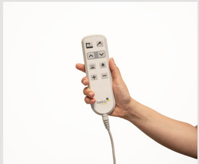
En option: télécommande intuitive avec toutes les fonctions