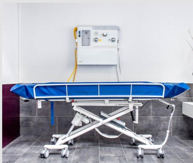
Kombinierte Dusch- oder Desinfektionslösung