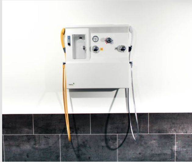
Modell DD: Mit Desinfektion und Duschfunktion