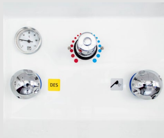
Einfache Bedienung, keine Stromversorgung notwendig