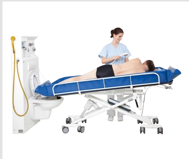
Ideale Ergänzung zu mobilen Duschsystemen