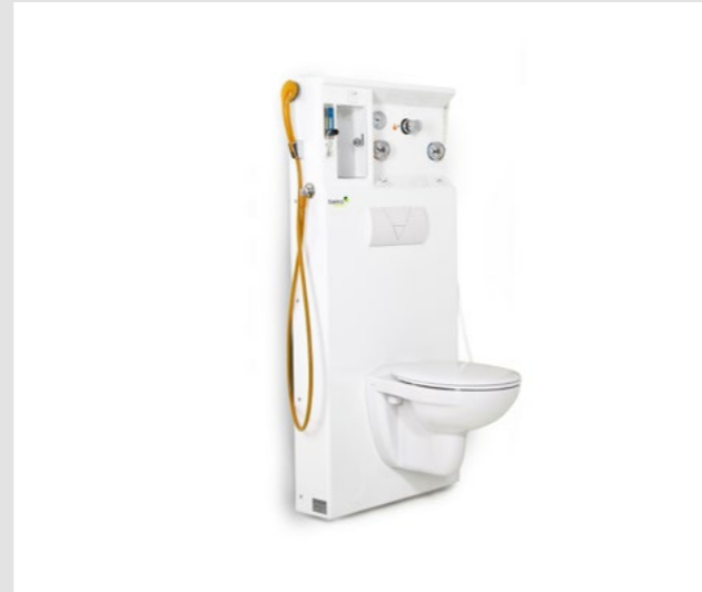
Modell mit WC: Mit Desinfektion, Duschfunktion und integriertem Patienten WC