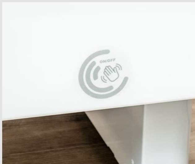
Funktionssperre aller Funktionen mittels Sensorschaltung (andere Sperrvarianten optional verfügbar)