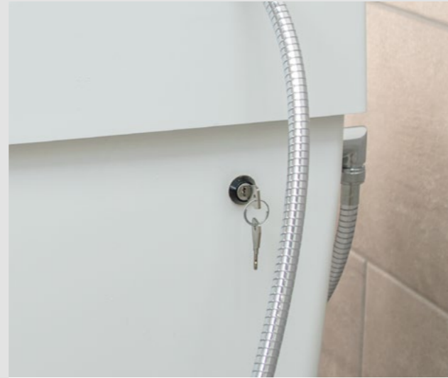
Optional: Serviceschalter zur thermischen Legionellenspülung* Deaktivierung des elektr. Verbrühschutzes durch Schließzylinder

*abhängig von bauseitiger Heißwasserversorgung